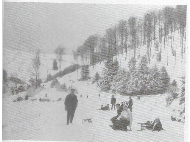
„In Schääna schneischt`s“ Rodelbahn vom Münchel mit Landheim der Lessingschule Mannheim im Hintergrund