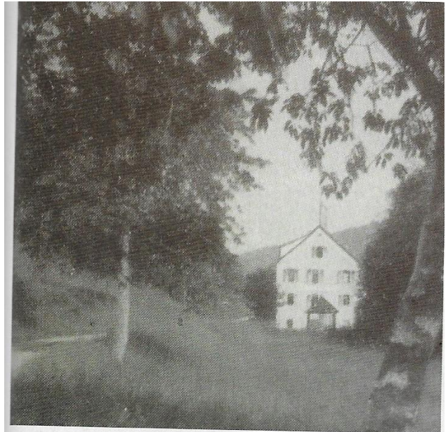
Münchelstraße mit Landheim der Lessingschule Mannheim Foto-Quelle: siehe Text